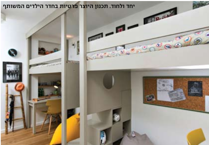
יחד ולחוד. תכנון היוצר פרטיות בחדר הילדים המשותף

תוכנן חדר רחצה צר אשר הכניסה אליו מתבצעת דרך הארון בחדר המרכזי. למעשה, הכניסה לחדר הרחצה איננה נראית לעין ונראה כי מדובר בארון בגדים לכל דבר