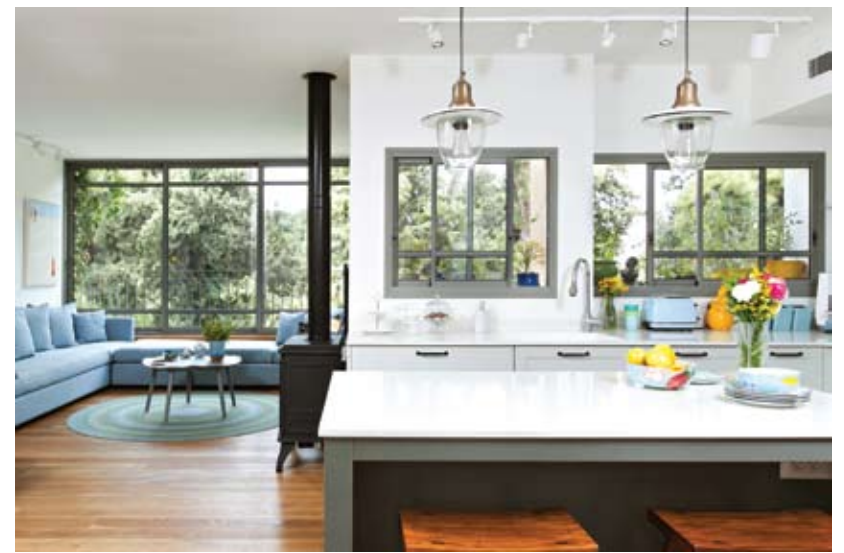
עיצוב הפנים נטמע בנוף הירוק החודר פנימה

המעצבת בחרה לרכוש דירה ישנה כך שתאפשר לה יד חופשית בשיפוץ, וללא מגבלת הממ"ד, המגביל מאוד מבחינה תכנונית בפרויקטים חדשים