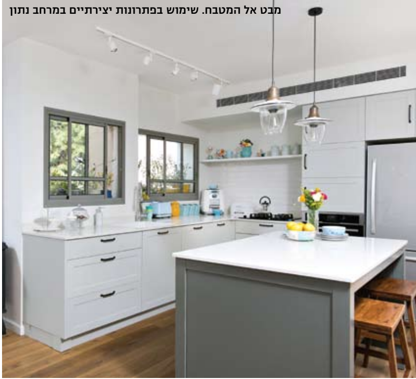
מבט אל המטבח. שימוש בפתרונות יצירתיים במרחב נתון

נוף ירוק של צמרות עצים ותחושה כללית של הימצאות בתוך יער. לפיכך, ההשראה הישירה לתכנון הדירה הגיעה מן הטבע המקיף אותה: אותם עצים ולהקות ציפורים האופייניים לשכונה הייחודית הזאת.